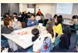
おやこ席キッズスペースも用意しました