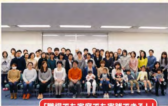
「職場でも家庭でも実践できる!」親の立場の方はもちろん、それ以外の方にも好評でした!