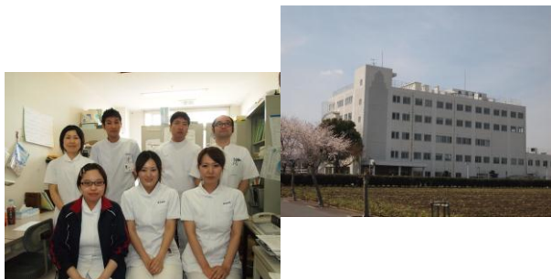
▲勝田病院職員の皆さん

茨城県にある、勝田病院、老健勝田が 4 月 1 日から AMG に加わりました。開設されたのは、勝田病院・老健勝田共に平成 5 年の 5 月で、一般病棟と療養型病棟、合わせて 85 床の病院に、併設の介護老人保健施設「勝田」からなります。