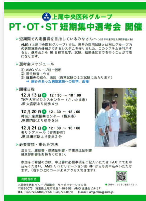
▲短期集中選考会ポスター

また、多くの学生みなさまに参加していただけるよう、実習生や近隣の養成校への声掛けなど、各施設でもご案内をお願いいたします。