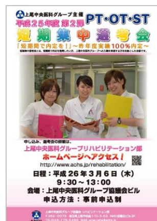
▲短期集中選考会ポスター

12月開催時はみなさまのおかげで希望者全員が内定となりました。ありがとうございました!!